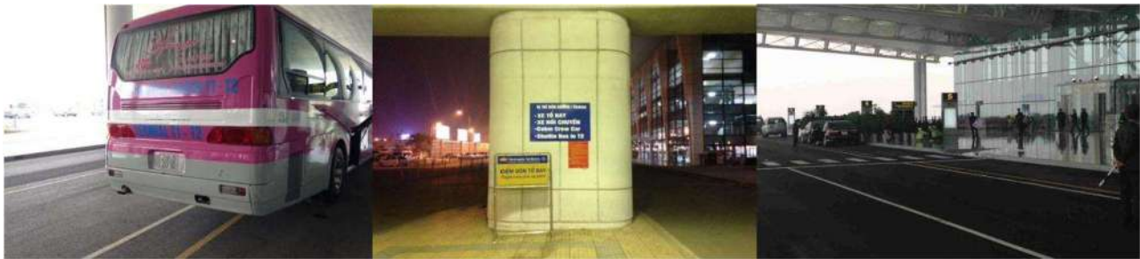
ターミナル1 シャトルバス乗り場

国内線ターミナル (T1) ⇄ 国際線ターミナル (T2) 間のシャトルバス乗り場は『Shuttle Bus To T2』 到着ゲートを出て右手に進んだ先にごさいます。現在 30 分間隔程度で運行中です。